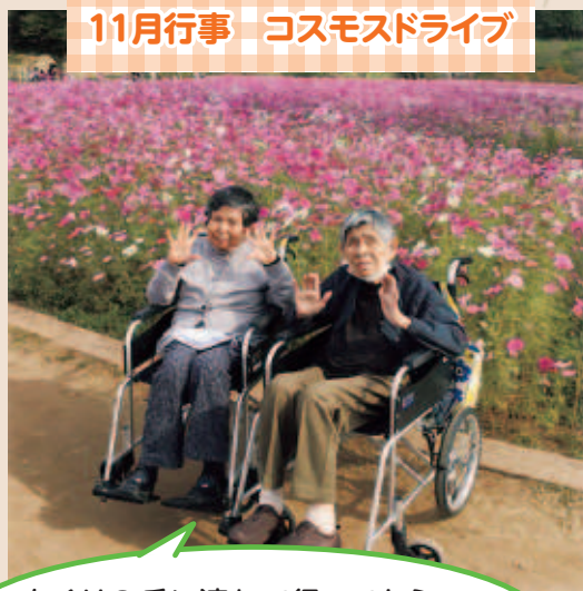
11月行事 コスモスドライブ