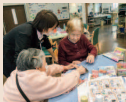
広告紙でごみ箱作り!