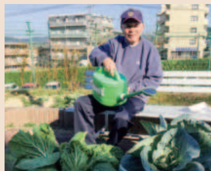
片手で水やりの作業中!