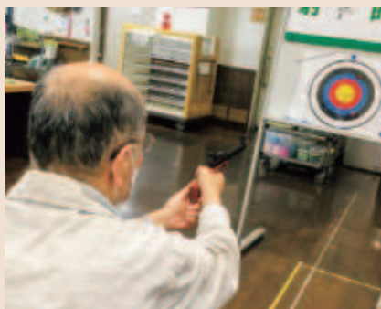
やる気に満ちあふれています!