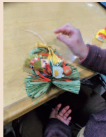
初めてのしめ縄づくりです!