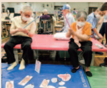
手際よく手を動かします!