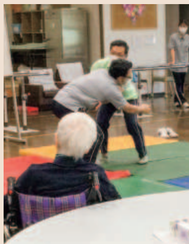
本気のぶつかり合いです!