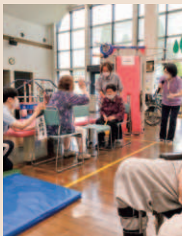
ひとり合戦やってます!