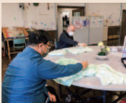
家事動作の練習です!