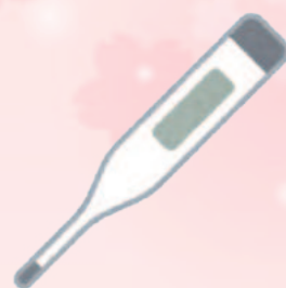
来所前の 体温測定をお願い