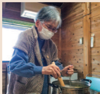
春の野菜ももうすぐ収穫です♪