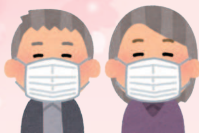
職員・利用者さんの マスク着用の徹底