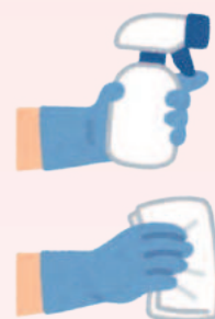
施設内を 定期的に拭き取り消毒