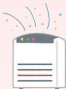
全部署に空間清浄化システムの SterilizAir<ステライザ>を導入