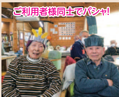
ご利用者様同士でパシャ!