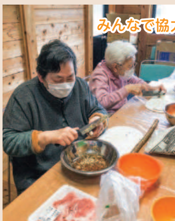
みんなで協力して料理しました