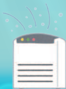
全部署に空間清浄化システムの SterilizAir<ステライザ>を導入