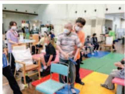
バランスとって両手投げ!