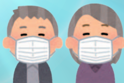
職員・利用者さんの マスク着用の徹底