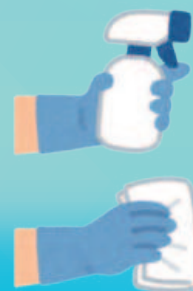
施設内を 定期的に拭き取り消毒