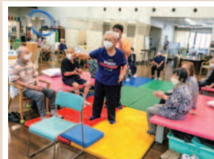
皆様の声援の中、全集中!