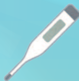
来所前の 体温測定をお願い